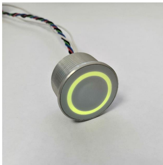
Рисунок 1 – Внешний вид изделия

1.1 Выключатель МКН-30ПК (далее – изделие) выполнен в нескольких исполнениях, отличающихся между собой материалом и цветом корпуса. Внешний вид изделия (материал корпуса – алюминий, цвет – «Металлик») приведен на рисунке 1.